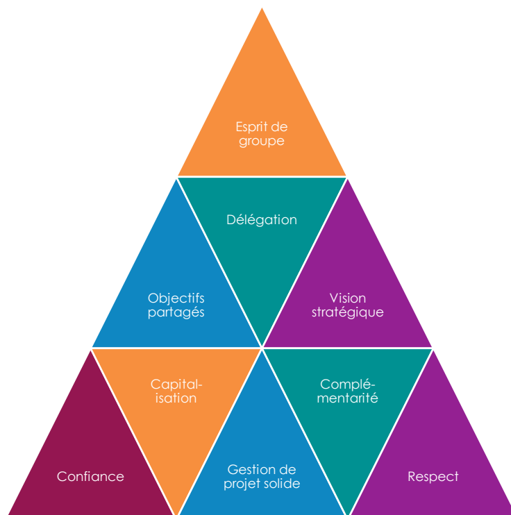
Figure 1 : Facteurs clés de succès des projets eLene

Ce schéma résume un certain nombre de facteurs clé de succès qui ont contribué à la réussite des différents projets. Mais peut-être pouvez-vous en identifier d'autres ?