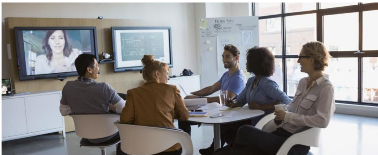
Figure 2 : Une réunion de lancement